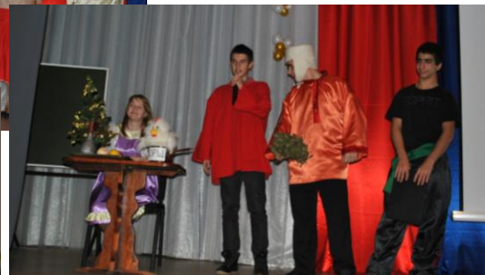
Школьная конференция также прошла очень интересно и плодотворно.