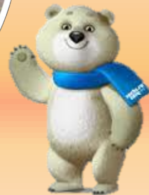
Спортивная эстафета «Олимпийские надежды» 3-и классы