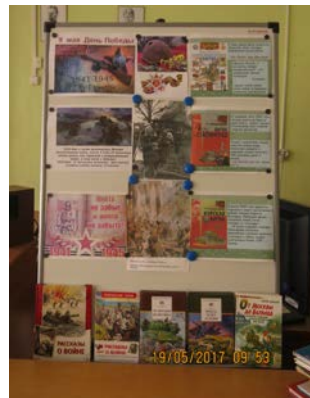
Книги о войне для учащихся средней школы