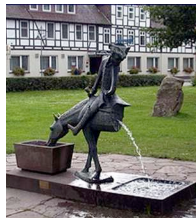
Памятники в городе Боденвердер (Германия)