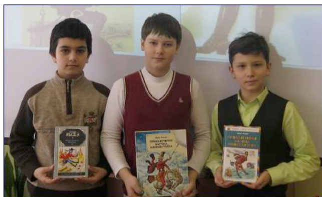
Самые активные ученики 4В класса, кто внимательно читал книгу о Мюнхгаузене и отвечал на вопросы викторины