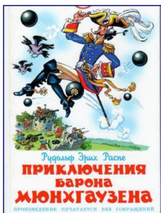
Книга в переводе К.Чуковского

✓ С 17 по 21 апреля в школьную библиотеку приходили ученики 3 и 4-х классов на уроки внеклассного чтения. Мы познакомились с удивительной книгой, которой уже больше 200 лет - про барона Мюнхгаузена, человека с очень богатой фантазией. Ребята с интересом слушали рассказ об истории книги и её герое, которого знают во многих странах мира. Настоящий барон жил в 18 веке в Германии в городе Боденвердер. Он был военным, воевал с турками и шведами, много путешествовал, бывал в России. Когда он вышел в отставку, то поселился в своём имении и стал известен в округе, как интересный, остроумный рассказчик. В его военных, охотничьих, морских историях трудно было понять, где правда, а где вымысел. Молодой, талантливый человек Эрих Распе, услышав эти рассказы, пересказал их и напечатал в журнале. Настоящий Мюнхгаузен был в бешенстве и даже подавал на автора в суд, считая, что он опозорил его на всю Европу. Но сегодня, спустя 200 с лишним лет мы понимаем, что он не опозорил, а обессмертил его имя. Многочисленные музеи, памятники на сюжеты его необыкновенных историй во многих городах и странах, говорят о популярности этого героя, который был, смел, находчив, умел выйти из любой жизненной ситуации. С помощью Презентации мы побывали в музее и родном городе героя, посмотрели отрывки из российского мультфильма про Мюнхгаузена.