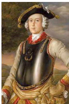
Портрет настоящего Мюнхгаузена