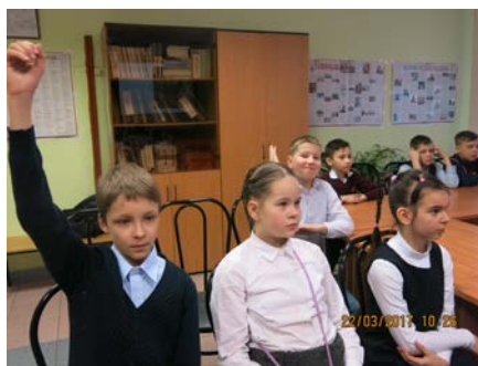
Ученики 4 Б класса на уроке в библиотеке