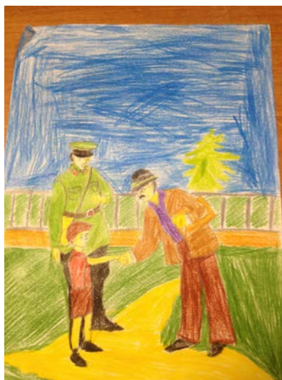
Рисунок Сорокина Димы, ученика 1 А класса