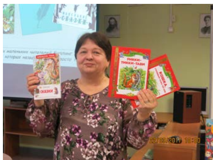
22 марта 2017 год

С интересом ребята обсуждали эту сказку. Ведь она написана на реальной основе. За последние 100 лет описаны около 30 случаев, когда дети выросли среди диких животных, даже появилось выражение «дети-маугли», т.е. те дети, которые выросли в необычных условиях. Но в жизни таких детей было не всё так хорошо, как описано в сказке. Книге про Маугли более 150 лет. Но сказка интересна и сегодня. Чему она может научить, что для себя можно взять из этой сказки? Ребята активно обсуждали это. Сказка учит: выживать в необычных ситуациях, уважению к старшим, умению жить в коллективе, взаимопомощи и взаимовыручке, настоящей дружбе, честности и смелости. На уроке мы также посмотрели отрывки из российского мультфильма.