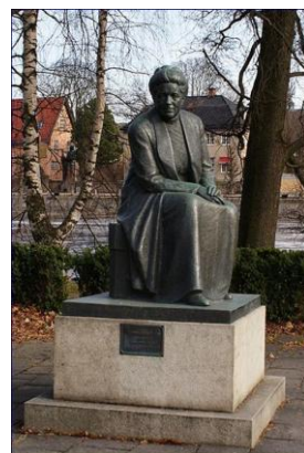
Портрет Сельмы Лагерлёф,