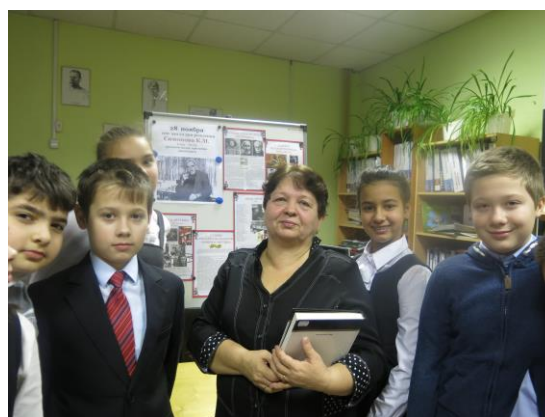
30 ноября 2015 года на библиотечном уроке с 5 Б классом: Знакомимся с книгами и смотрим презентацию «Жизнь, судьба, личность поэта М.Ю.Лермонтова», отвечаем на вопросы викторины по стихотворению «Бородино».