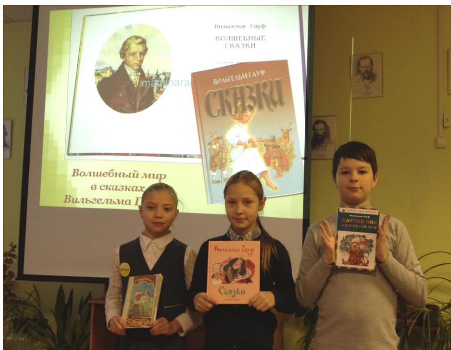
Ученики 4-А класса на уроке внеклассного чтения по сказкам Гауфа, 23 ноября 2015 год.