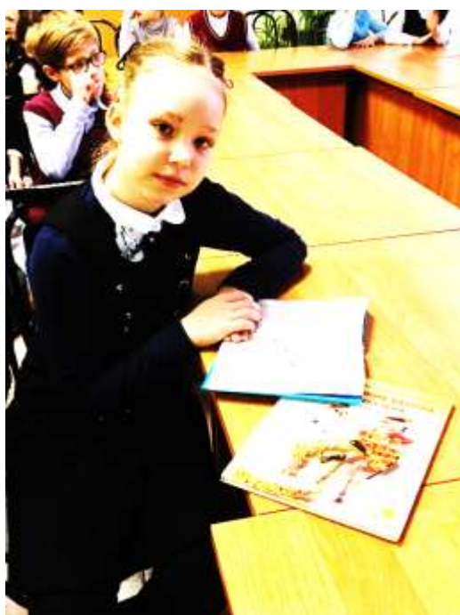
Читаем книгу о Мюнхгаузене