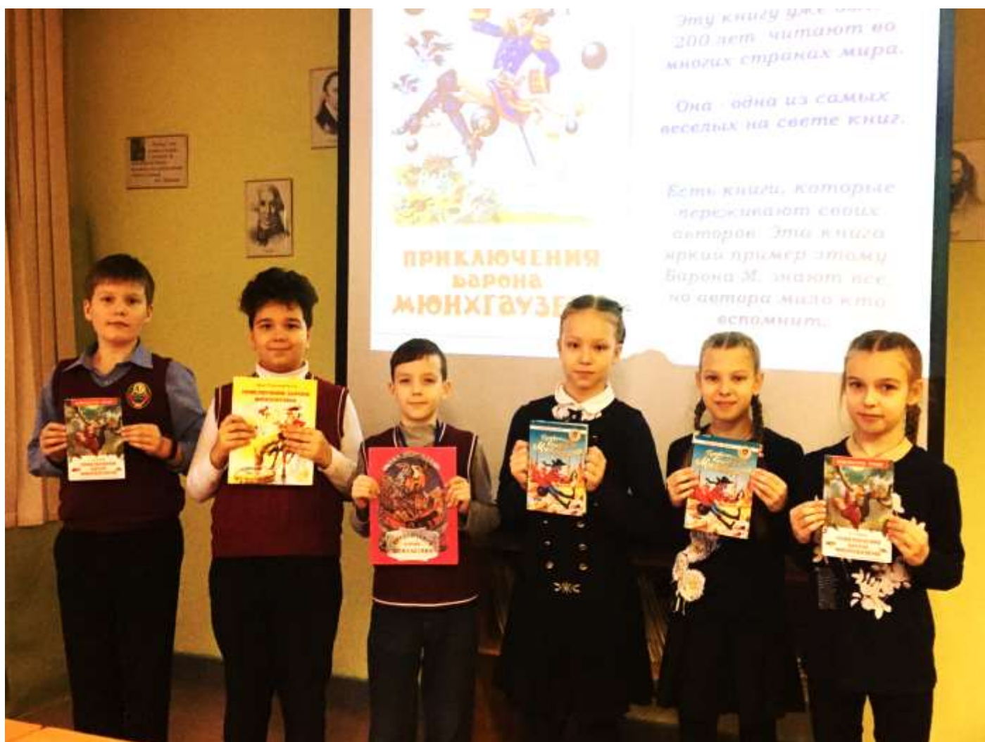
Обучающиеся 3 А класса в школьной библиотеке